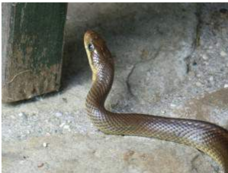
Äskulapnatter – Heilung und Schutz

Der Feiertag vor zwei Tagen hatte bereits eine andere Energie, als bisher. Vorbei ist die Zeit, in der wir Frondienst an einem "Leichnam" leisten (Fronleichnam), nämlich an dem, was tot ist und immer schon tot war. Vorbei ist damit auch die Macht der alten Systeme, die genau das von den Menschen eingefordert haben. Es war ein Tag, an dem sich die Urkraft gezeigt hat, die Schlange – deren Heilung wir damals am Titicaca-See in Gang gesetzt haben.