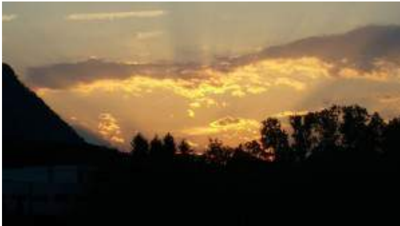
Stimmung beim Untersberg (Sophie JJ)

Als sie einen Tag später dann auf mich zukam (nachdem sie sich in den letzten Wochen schon mehrere Male gezeigt hat), war klar, dass der Abschluss da ist und das Gleichgewicht von männlicher und weiblicher Kraft auf einer bestimmten Ebene erreicht ist. Das ist ein grosses Ereignis und der endgültige Abschied von dem, was bisher war und die Menschheit unter das Joch der verrohten und missbrauchenden männlichen Kraft gezwungen hat. Die Schlange hat sie herausgefordert und in ihre Schranken gewiesen. Jetzt wird sie wieder genährt, damit sie nun bald nicht mehr Amok laufen muss... weil sie glaubt, sich nur so an der Macht halten zu können.