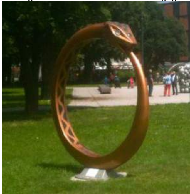
Ourobourus-Schlange vor dem Musiktheater Linz (Österreich)

Aber der heutige Tag zeigt bereits etwas anderes an. Die Schlangenkraft ist zurück, die alte Macht eine leere Hülle geworden... Während wir nach aussen hin immer mehr die Beschneidung unserer Menschen- und Geburtsrechte erleben, haben wir jetzt die einzigartige Chance, uns wieder zu verbinden mit unserer uralten Kraft, die mit der Erde eins ist und die Wärme des lebendigen Feuers ausstrahlt. Und das ist unvergleichlich mächtiger, als all das, womit man uns jetzt noch einmal schnell Angst machen will. Denn die Elitenmacht der Erde lebt von der Angst und vom Missbrauch unserer Kraft. Wenn wir uns jedoch von innen heraus diesem Treiben entziehen und so unsere Schwingung stetig anheben, sind wir plötzlich unsichtbar für sie – ... und sie werden sich die Augen reiben und schliesslich dankbar sein, dass wir sie auf diese Weise aus ihrer Sackgasse erlöst haben. Das also liegt ganz in unserer Macht!